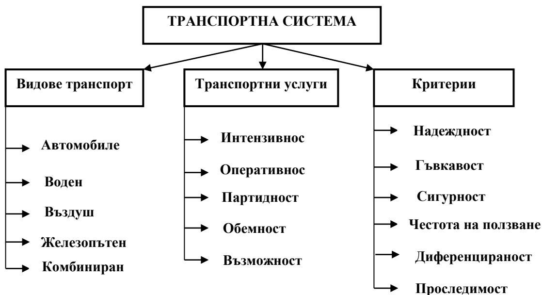
Фиг. 2. Структура на транспортната система

Анализа на Фиг.2 ни дава възможност да обобщим най-съществените елементи на системата. Най-голямото предимство на автомобилния транспорт е, че транспортният процес се извършва от отправния пункт до крайното местоназначение на стоката, т.е. от склада на изпращача до склада на получателя, което спестява допълнителни товаро-разтоварни операции. То се дължи на високата маневреност и голямата проходимост на автомобилите. Възможността за извършване на директни превози създава условия за реализиране на редица преимущества [3]: